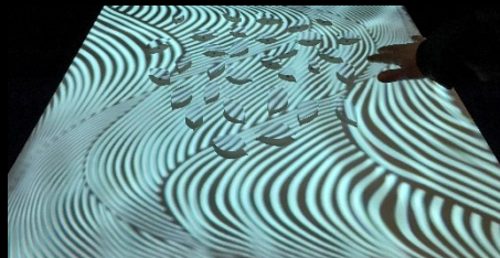
ハモン・ド・タッチ