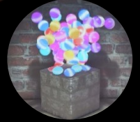
ファンタジーボックス