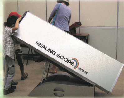
おおがたまんげきょう 大型万華鏡 (ヒーリングスコープ)