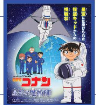
配給 コニカミノルタプラネタリウム