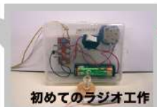
初めてのラジオ工作

日時| 3/21(土) 13:00-15:30 場所|1階 第1休憩室 参加費|1,000円 定員|15名 対象|小学生以上 申込|2/21(金)よりHPで受付