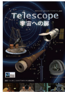
配給 コニカミノルタプラネタリウム

あなたが、最後に星 空を眺めたのはいつで すか? 人類が初めて望遠鏡を 夜空に向けてから今年 で400年。 最初にレンズを通して 宇宙を見たときの驚き や喜び、その後の天文 学者たちが辿った発見 の歴史を鮮やかな映像 で追体験します。