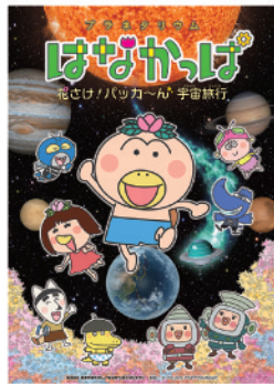
配給 コニカミノルタプラネタリウム株式会社