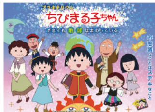
配給 コニカミサルタ プラネタリウム株式会社

「地球は回っている?それに気づいたのはだれ?」ふと疑問に感じたまる子。もっと地球や宇宙の事を知りたいと思ったまる子たちは科学館へ遊びに行くことに。