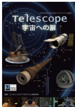
Astrolab 配給 ユニカミノルタプラネタリウム

あなたが、最後に星空を眺めたのはいつですか？天文学者たちが辿った発見の歴史を鮮やかな映像で追体験します。