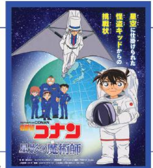
配給 コニカミノルタプラネタリウム